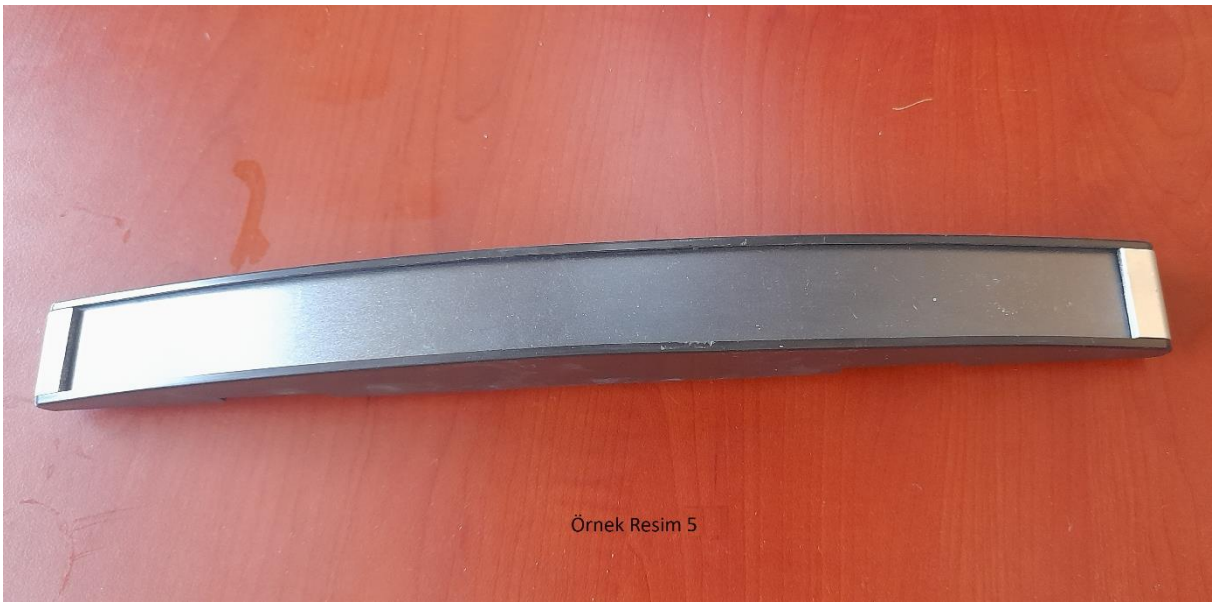
Örnek Resim 5