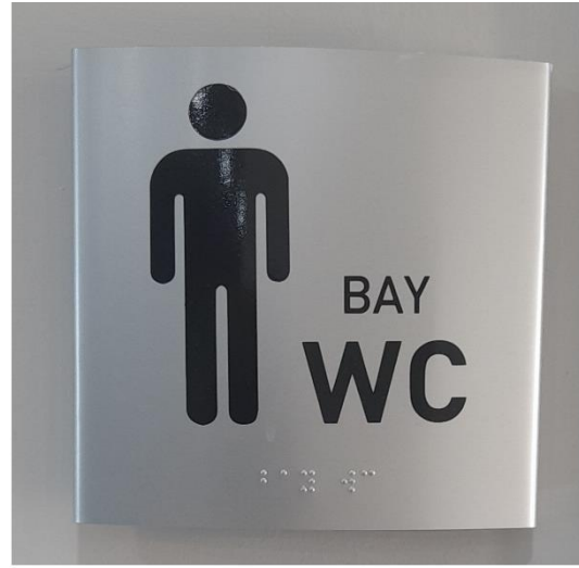
Örnek Resim 2