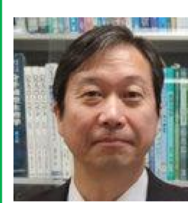
Prof. Dr. Kiichi FUKUI Osaka University Japan