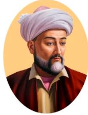
Ali Şîr Nevâî