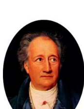
Johann Wolfgang Von Goethe