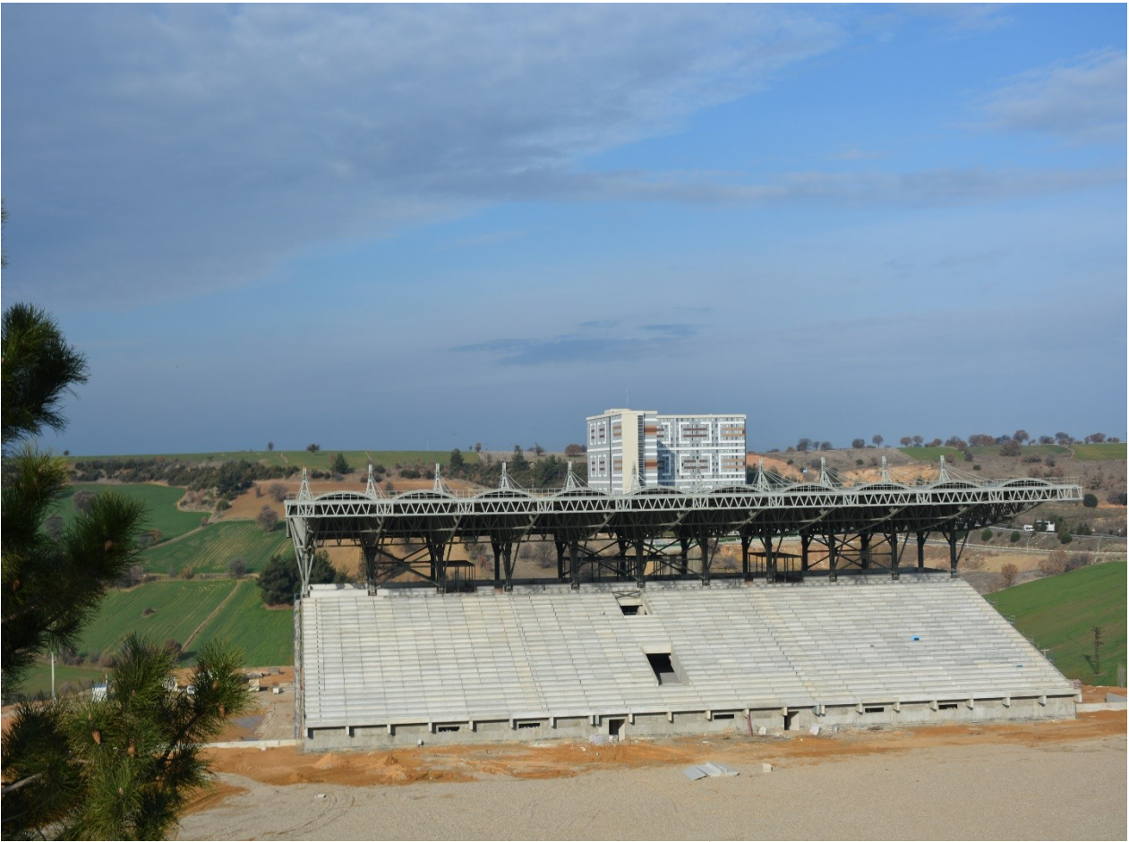
(Spor Bilimleri Fakültesi ve Sentetik Atletizm Pistli Futbol Sahası İnşaatından bir görünüm)

Bu projeden sorumlu birimimiz Yapı İşleri ve Teknik Daire Başkanlığımızdır.