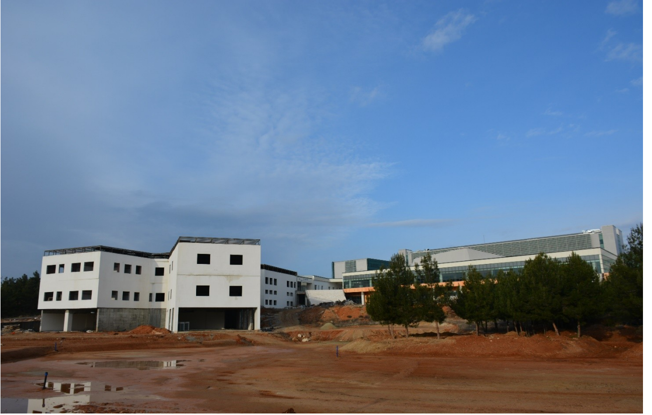
(Derslik ve Merkezi Birimler Projesi kapsamında yapılan Öğrenci Yaşam Merkezi ve Yemekhane Binası fotoğrafı)