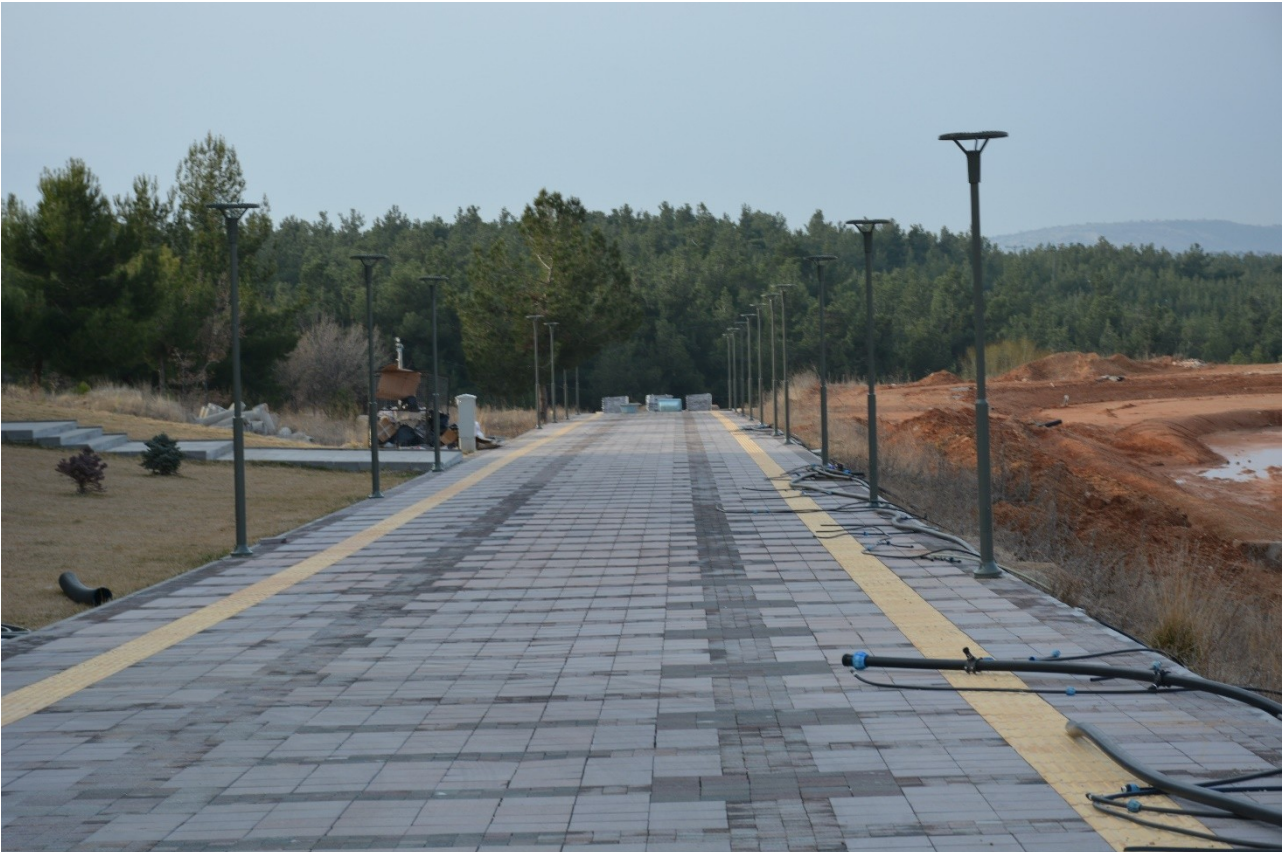
(Kampüs Altyapı Projesi kapsamında yapılan Çevre Düzenlemesi fotoğrafı)