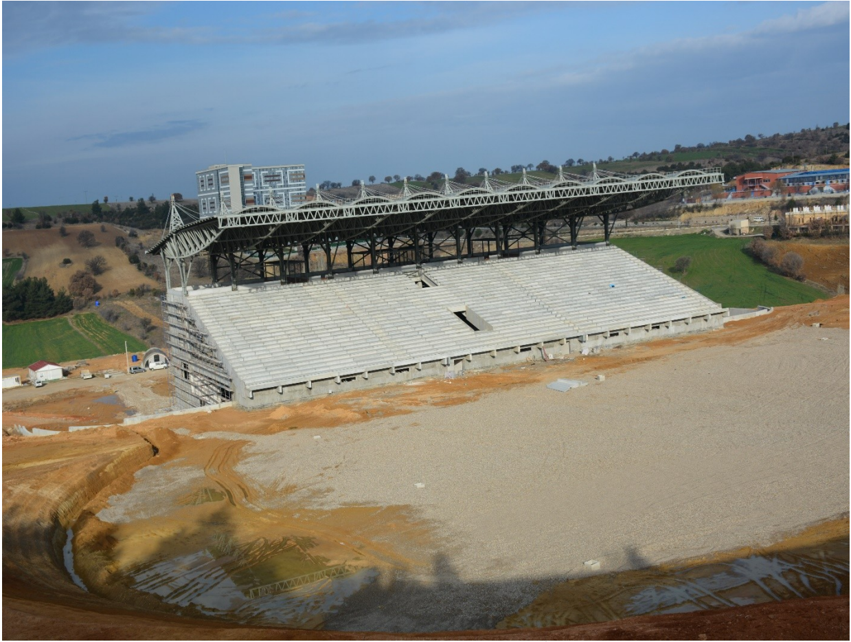
(Spor Bilimleri Fakültesi ve Sentetik Atletizm Pistli Futbol Sahası İnşaatından bir görünüm)