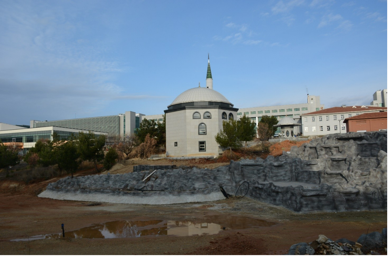
(Kampüs Altyapı Projesi kapsamında yapılan Suni Gölet fotoğrafı)