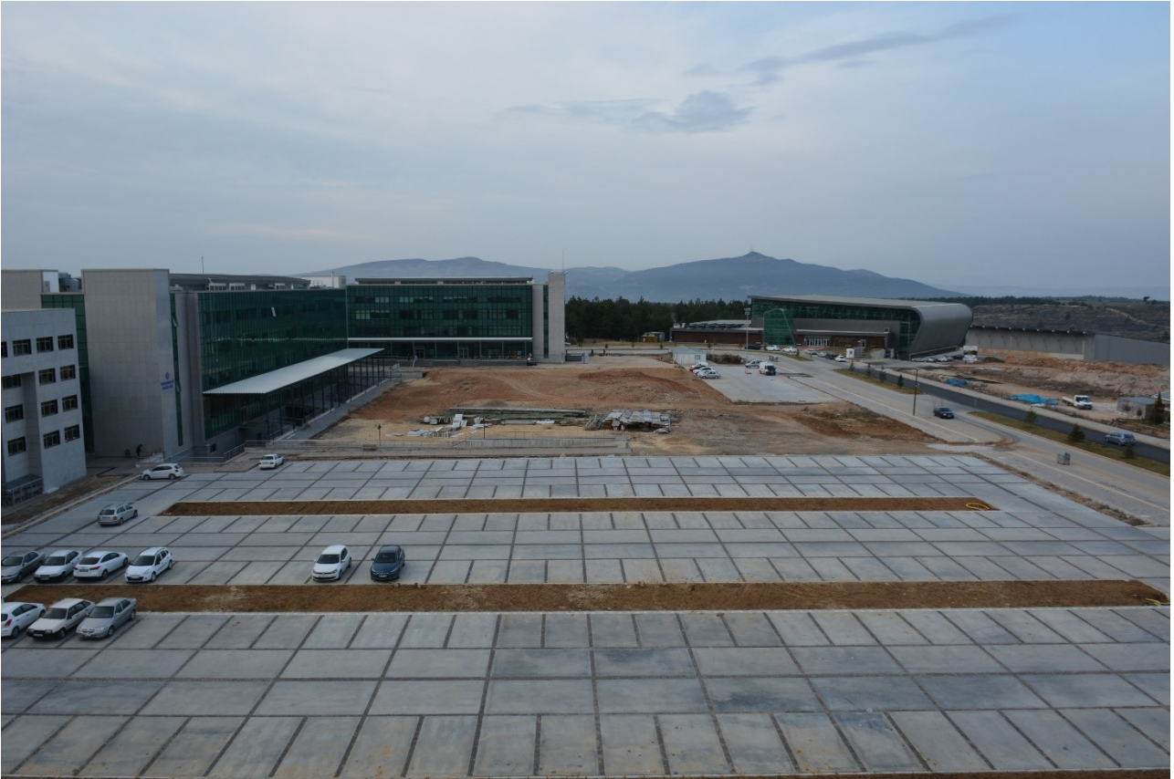
(Kampüs Altyapı Projesi kapsamında yapılan Çevre Düzenlemesi fotoğrafı)