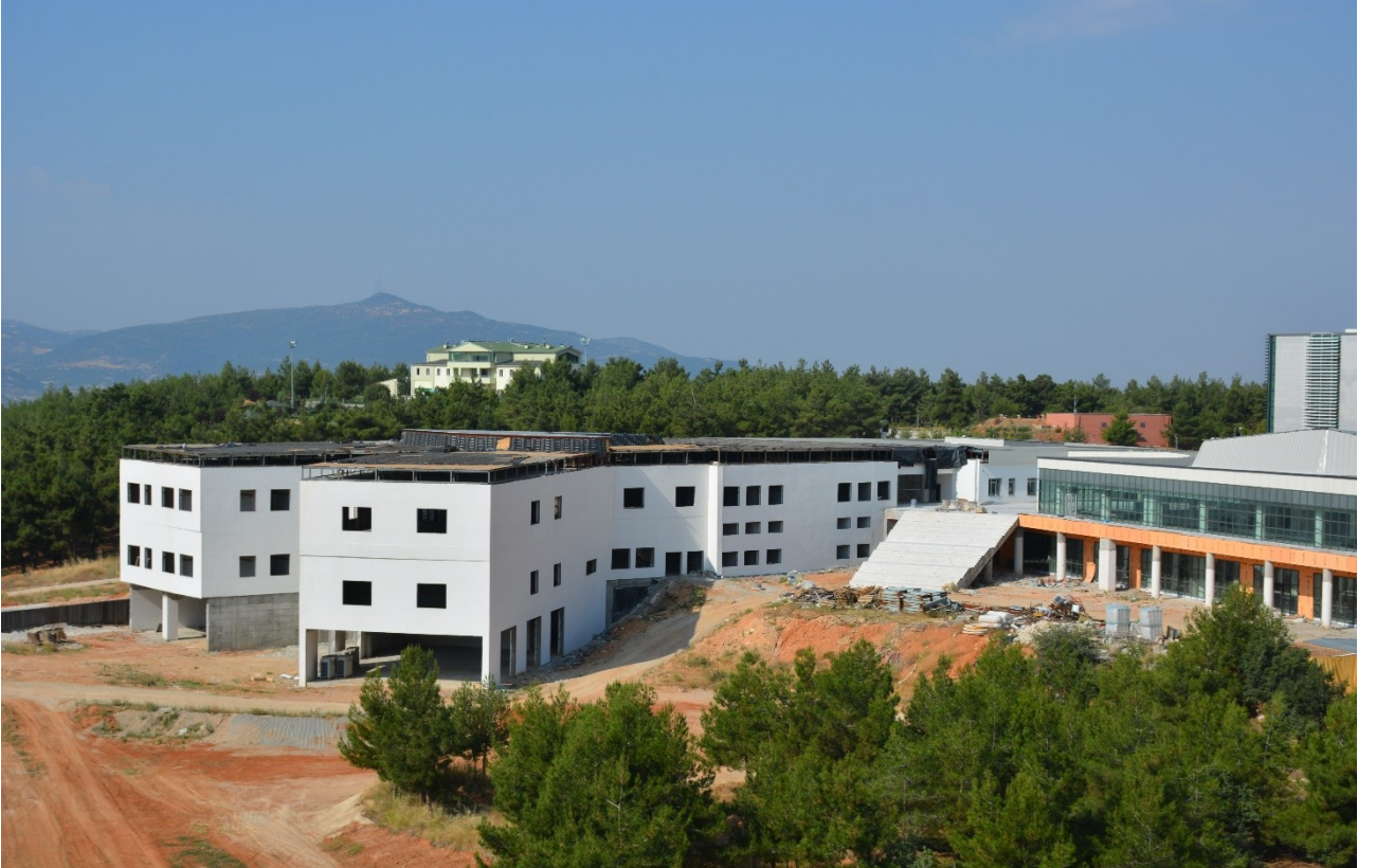
(Derslik ve Merkezi Birimler Projesi kapsamında yapılan Öğrenci Yaşam Merkezi ve Yemekhane Binası fotoğrafı)